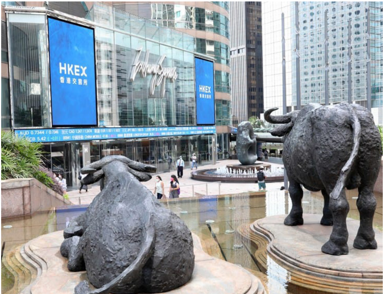
Kantor Hong Kong Exchanges and Clearing Limited

BEI bersama dengan OJK juga sedang mempersiapkan untuk menerbitkan shareholder concentration list , di mana nantinya dalam mekanisme tersebut mereka akan mengungkap afiliasi di balik nama kepemilikan saham sebuah emiten.