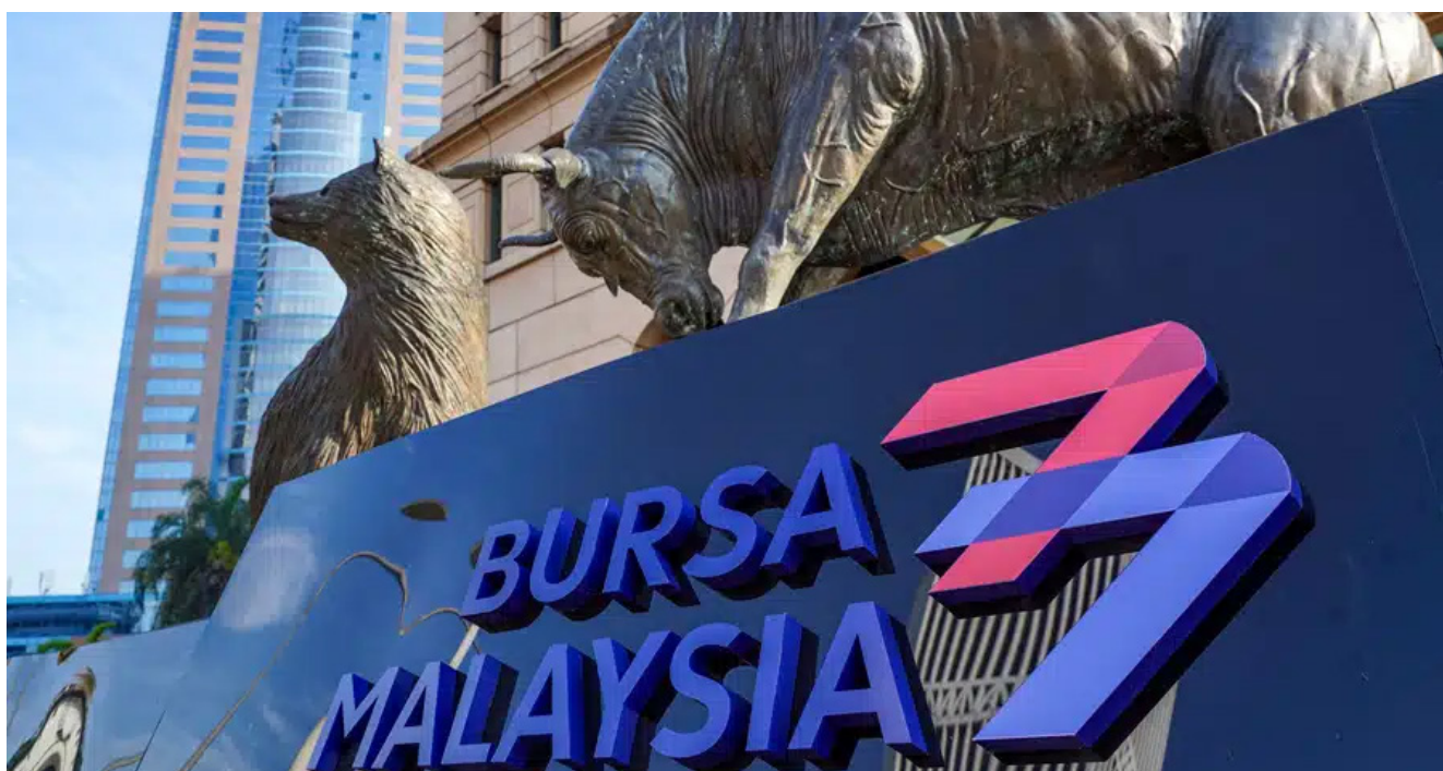
Kantor vursa efek Malaysia

Malaysia di main market menetapkan minimum free float sebesar 25% dengan fleksibilitas bagi emiten besar. Otoritas Malaysia juga mengambil langkah untuk memperkuat transparansi struktur kepemilikan saham, khususnya yang terkait dengan penggunaan akun nominee .