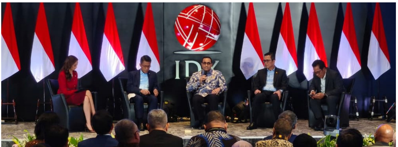
Pejabat Sementara (Pjs) Kepala Eksekutif Pengawas Pasar Modal Otoritas Jasa Keuangan Hasan Fawzi saat bicara di Market Outlook 2026 Capital Market Reform: Integrity and Credibility di Jakarta Selasa, (3/3/2026)

“Kami memberikan arahan untuk dilakukan peningkatan transparansi pengungkapan keterbukaan informasi kepemilikan saham emiten, dengan pengungkapan data terperinci atau granularity , yang akhirnya ditindaklanjuti oleh KSEI yang kemudian diperinci lagi,” kata Hasan kepada SUAR.