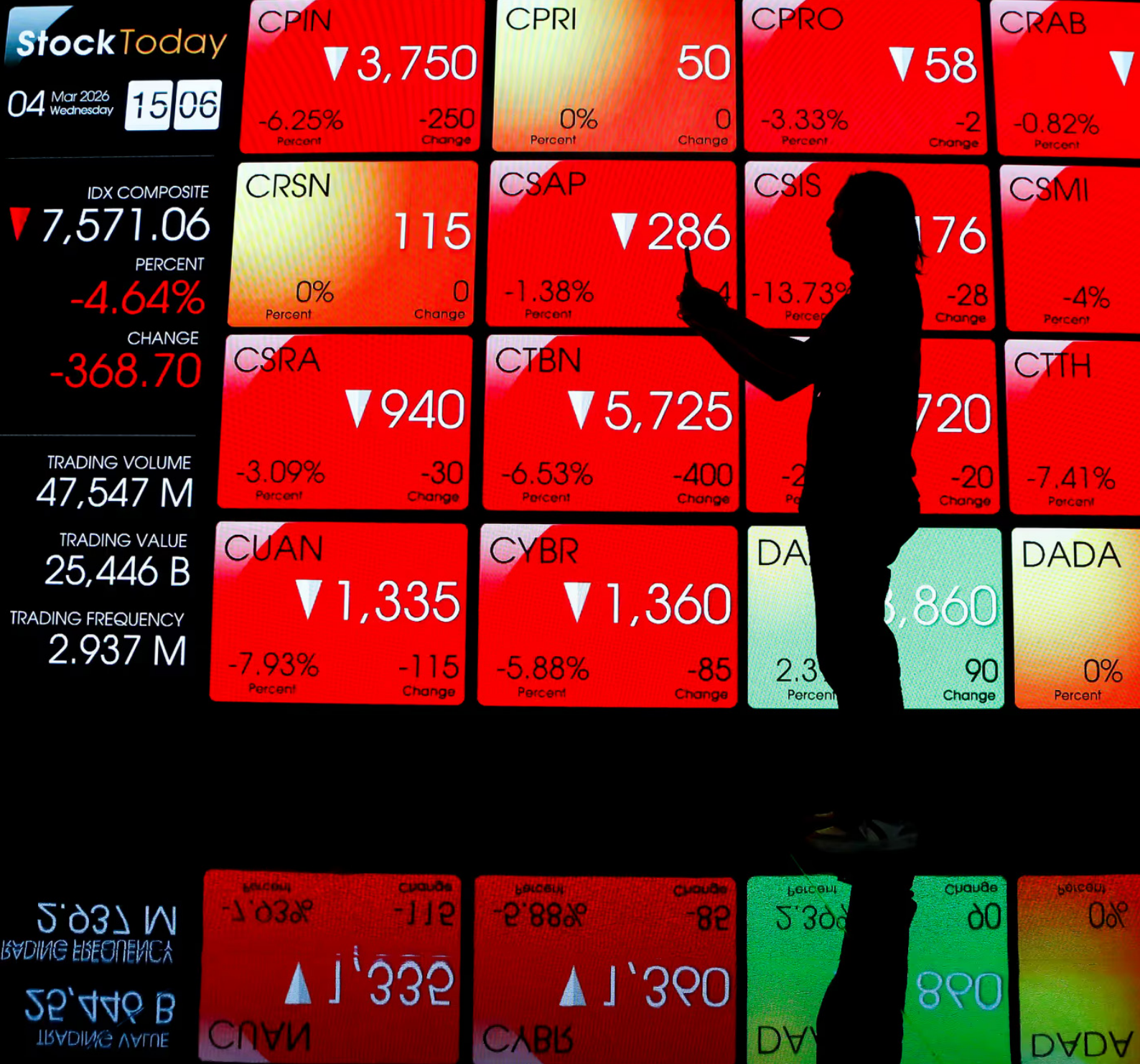
Pengunjung melintas di depan layar yang menampilkan pergerakan Indeks Harga Saham Gabungan (IHSG) di Bursa Efek Indonesia, Jakarta, Rabu (4/3/2026).