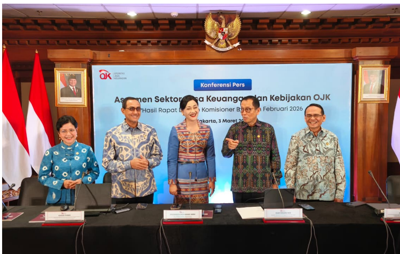
Konferensi Pers Hasil Rapat Dewan Komisiner Bulanan (RDKB) Otoritas Jasa Keuangan (OJK) di Kompleks Perkantoran Bank Indonesia, Jakarta Pusat, Selasa (03/03/2026).

Bursa Efek Indonesia (BEI) dan Kustodian Sentral Efek Indonesia (KSEI) secara resmi menerbitkan informasi mengenai kepemilikan saham perusahaan tercatat di atas 1% pasca penutupan pasar, Selasa 3 Maret 2026 lalu.