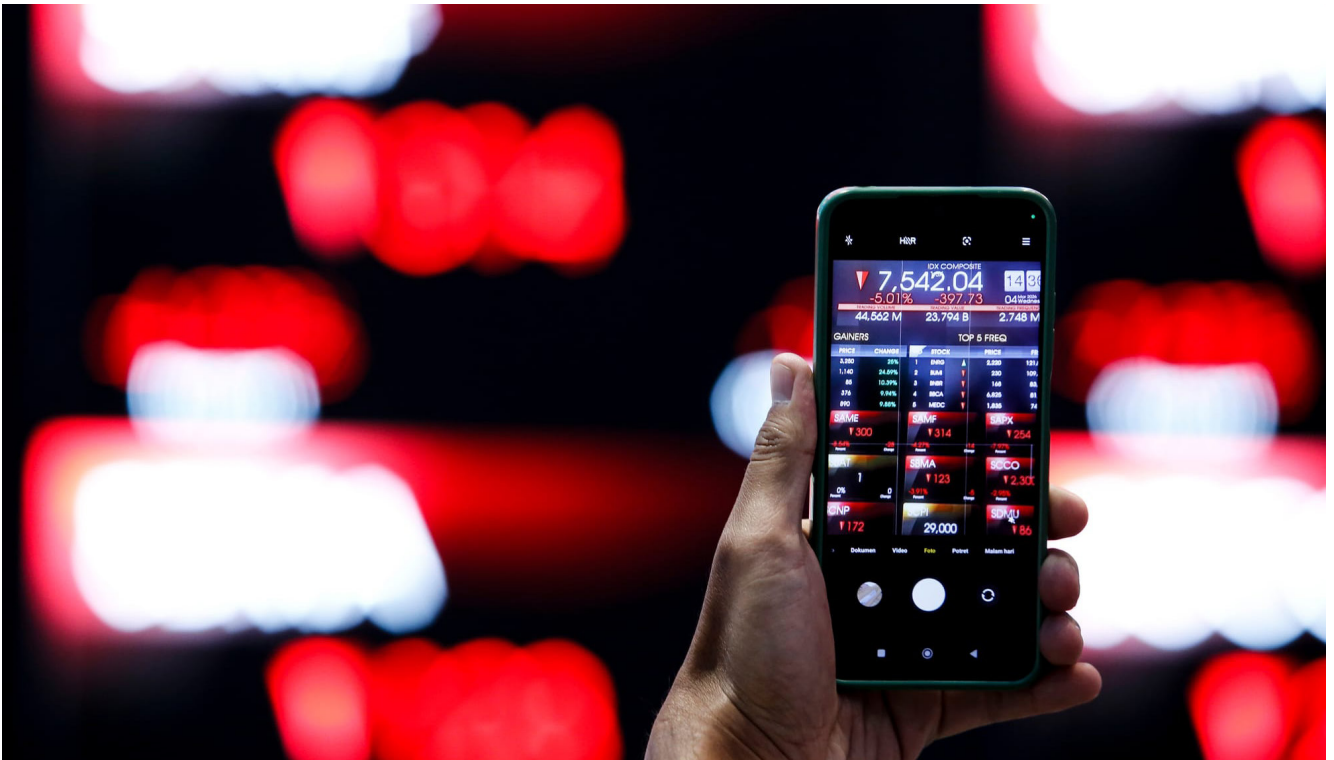
Pengunjung memotret layar yang menampilkan pergerakan Indeks Harga Saham Gabungan (IHSG) di Bursa Efek Indonesia, Jakarta, Rabu (4/3/2026).

Pasar modal memegang peranan penting dalam pertumbuhan ekonomi, meski sebagian besar ekonomi Indonesia itu tidak bergantung dari pasar saham, namun ke sektor riil. Tetapi, dinamika yang terjadi di pasar saham juga turut menentukan. .