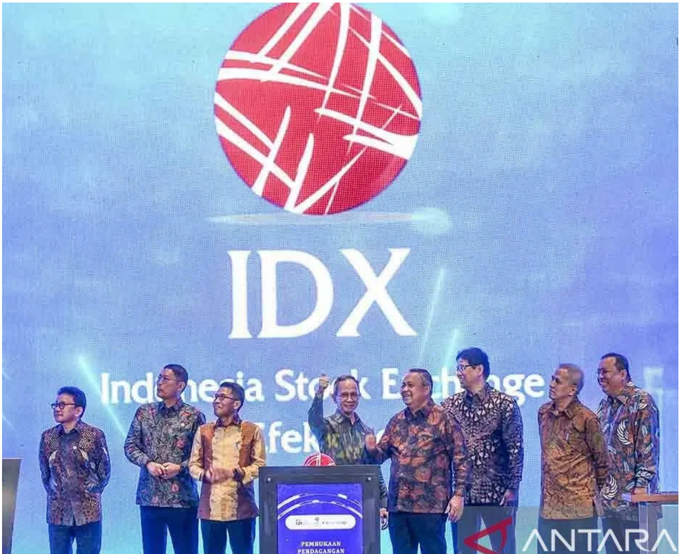
Pembukaan perdagangan saham 2026 di Bursa Efek Indonesia, Jakarta, Jumat (2/1/2026).

“Kita akan menggabungkan best practices yang ada di India dan di Hong Kong, kita akan lakukan itu di sini sehingga setelah ini sepertinya kita akan menjadi salah satu bursa yang paling transparan,” ia berharap.