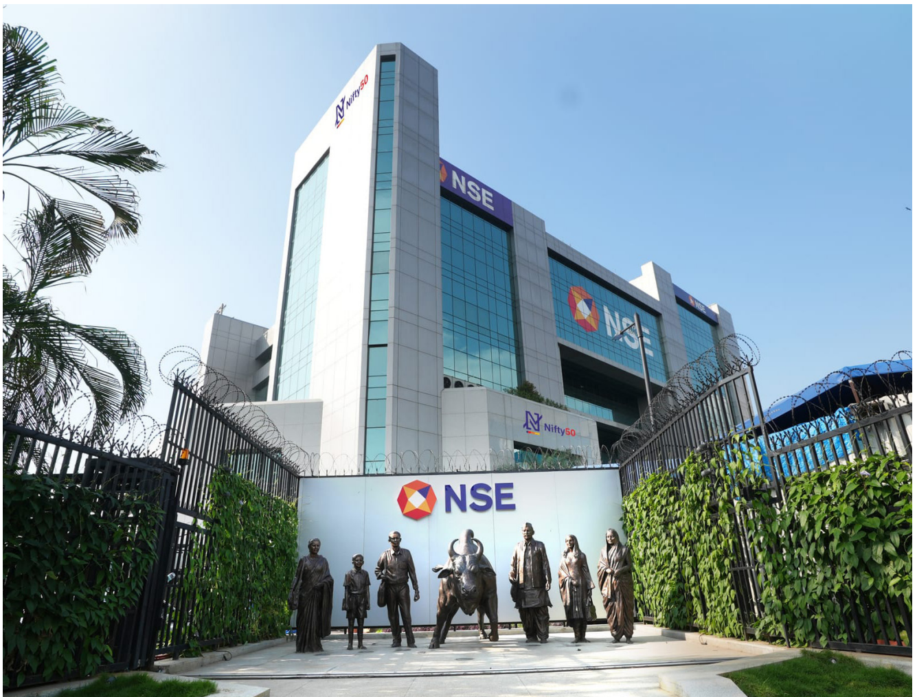
Kantor pusat NSE India

Di negara-negara tersebut, kepemilikan publik di atas 1% diungkap secara terbuka, sementara data kepemilikan di bawah 1% juga tetap dapat diakses melalui permintaan. Standar ini dinilai jauh lebih tinggi dibandingkan praktik yang berlaku di Indonesia saat ini.